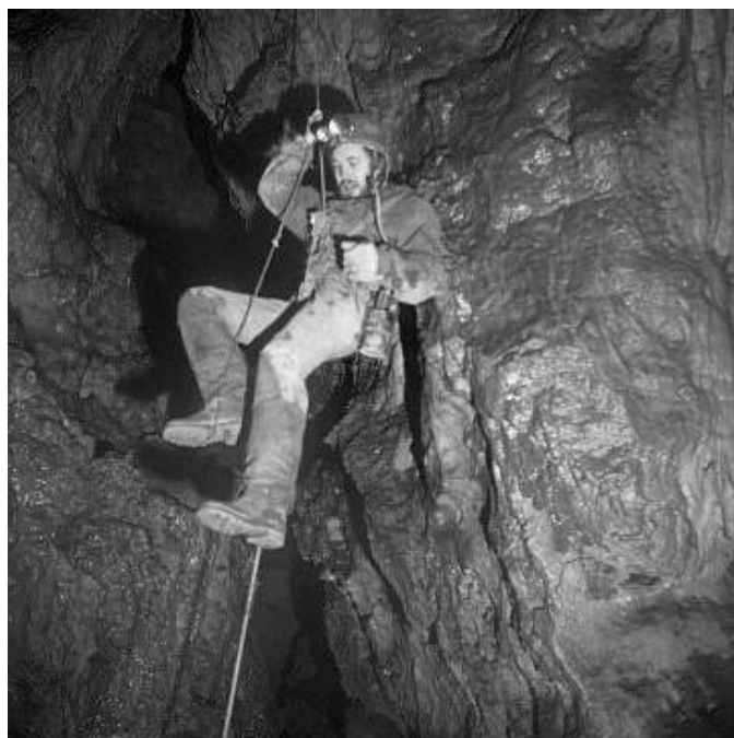
V jami Pekel, 11. 1. 1975.