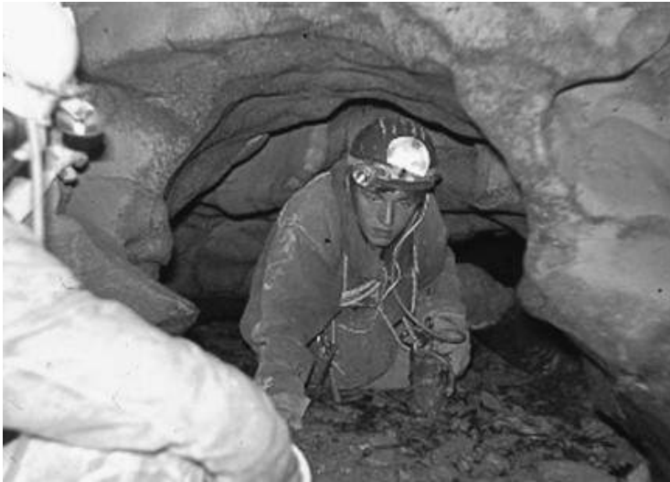
Žankana jama, oktober 1968.