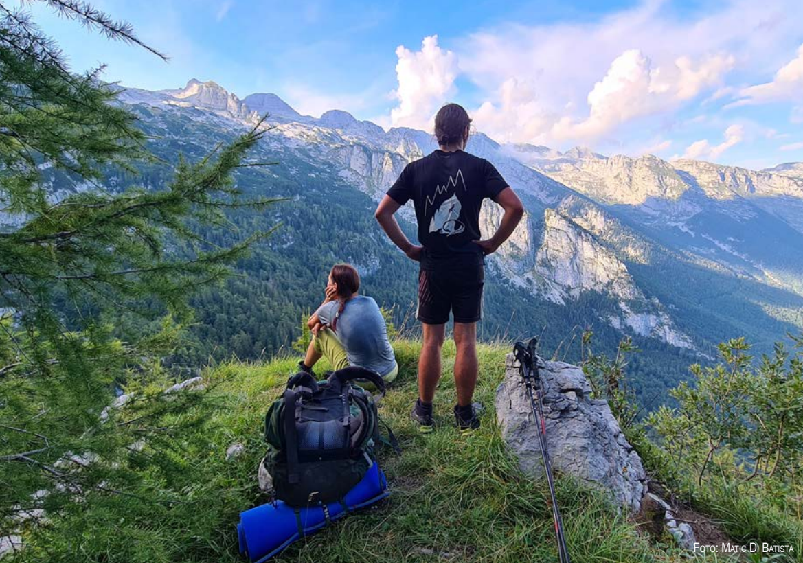
Razgledna točka na poti v dolino.